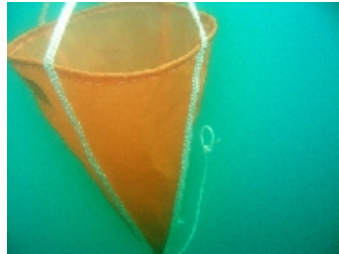
Equilibrado para flotación neutra