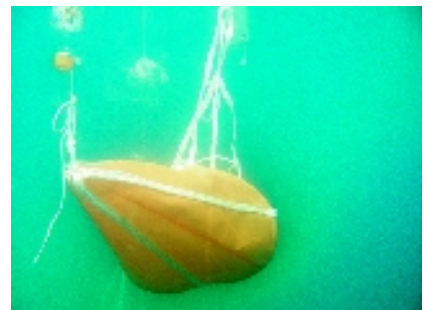
Diferentes momentos durante el ajuste